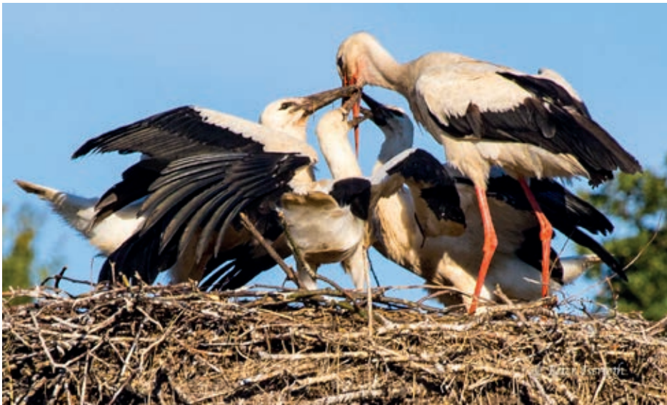
In Stemwarde wurde gut gefüttert (P. Iserloth),