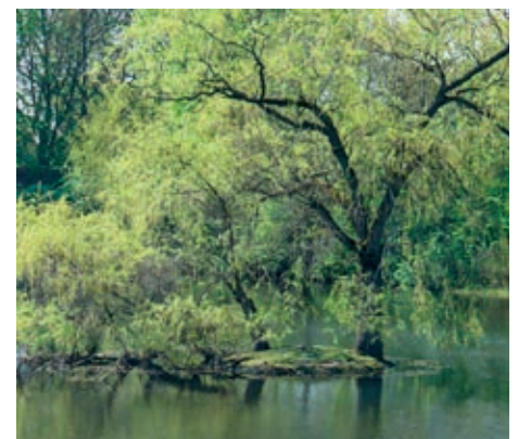
Eine umgestürzte Weide im Regenrückhaltebecken treibt neu aus.

im Vordergrund ihrer Tätigkeit. Seit nunmehr zehn Jahren unterhält die Gemeinde ein digitales Baumkataster. 4000 Gehölze und über 100 verschiedene Arten von Bäumen sind hier aufgeführt. „Unser Bestand ist von großer Bedeutung für die lokale Biodiversität. Die Bäume werden nach Baumpflegerichtlinien individuell in festgelegten Kontrollintervallen auf ihre Sicherheit geprüft.“, erläutert Lutz. Zuletzt habe sich die alte Eiche an der Willinghusener Landstraße auf Höhe des Stellauer Weges einem Zugversuch unterziehen lassen müssen. So wurde sichergestellt, dass der Baum noch standsicher ist