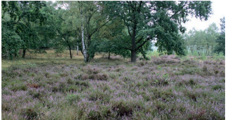
Die Willinghusener Heide ist die einzige ihrer Art im Gemeindegebiet.

In Barsbüttel hatten die ab 1990 zu zweit agierenden Umweltbeauftragten zudem die Aufgabe, sich um die Problematik der zahlreichen Altlasten im Gemeindegebiet zu kümmern, die saniert werden mussten. Besonders zwei ehemalige Hausmülldeponien nahmen viel Arbeitszeit der beiden Frauen in Anspruch: Zum einen die Altablagerung Nr. 78, auf der sich eine Bebauung mit Wohnhäusern befand, die langsam absackte; zum anderen die Altablagerung Nr. 80, die Stoffe mit besonderem Gefährdungspotential enthielt und daher vor einer Bebauung versiegelt werden musste.