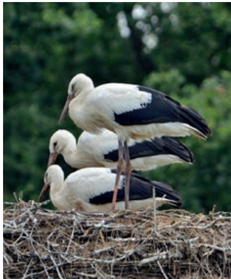
Unsere Drei in Stemwarde (H.Sönksen)

Nun heißt es warten, dass alle Störche gesund und sicher aus ihren Winterquartieren zurückkehren und die Horste an ihren Geburtsorten belegen.