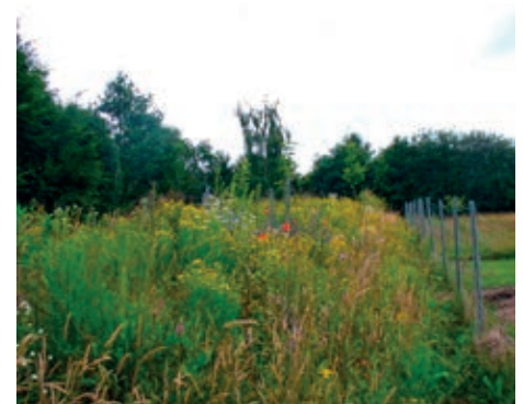
Das Bienentrachtband in voller Blüte.