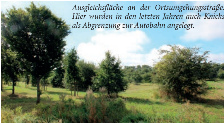
Ausgleichsfläche an der Ortsumgehungsstraße. Hier wurden in den letzten Jahren auch Knicks als Abgrenzung zur Autobahn angelegt.

und nichts gegen den Erhalt als ortsbildprägendes Gehölz spricht. „Durch eine angepasste Baumpflege lassen sich alte Bäume oft noch über viele Jahre hinweg als Lebensraum erhalten. Das bringt im Hinblick auf die ökologische Leistung des Baumes wiederum einen Zugewinn für Mensch und Natur.“, resümiert Lutz.