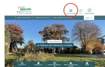
Die wichtigsten Anliegen im Rathaus